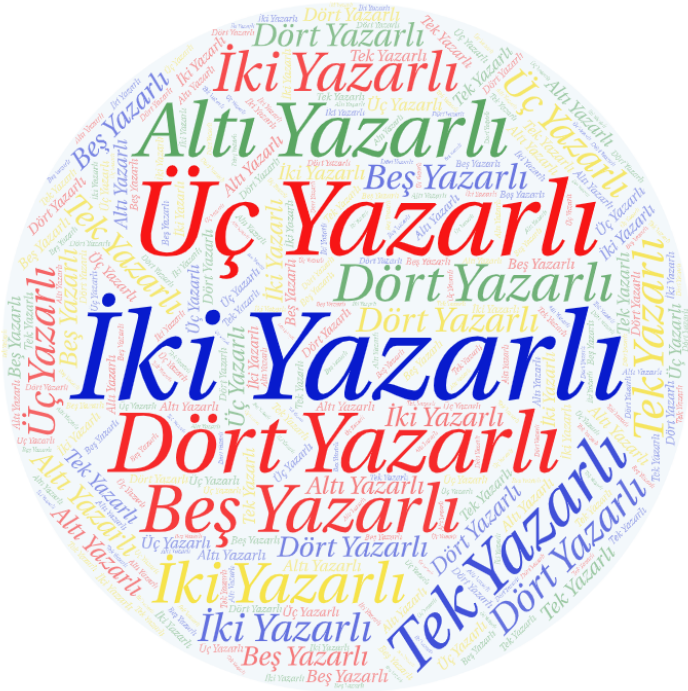
Şekil.6.5. Makalelerin Yazar Sayılarına İlişkin Kelime Bulutu Analizi

Şekil 6.5’de makalelerin yazar sayılarına yer verilmektedir. Şekil incelendiğinde “İki Yazarlı” makalenin öne çıktığı görülmektedir. Ayrıca “Üç Yazarlı” ve “Tek Yazarlı” makalelerinde dikkat çektiğini söyleyebiliriz.