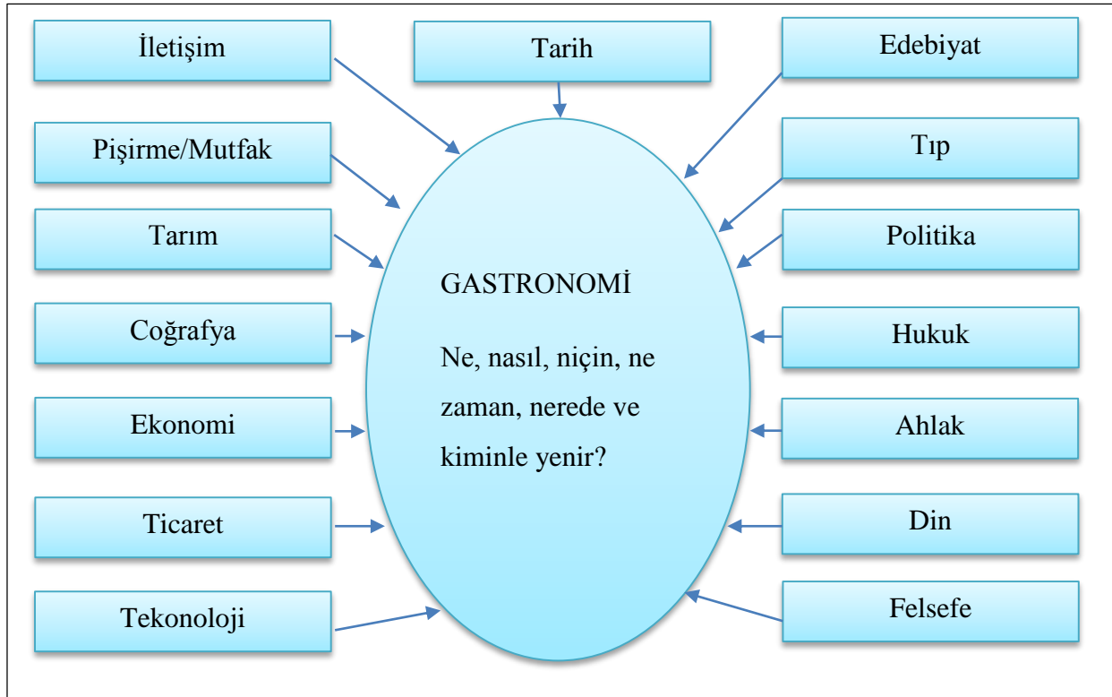
Şekil 3.1.1. Gastronomi Bilimi İçin Çok Disiplinlerarası Bir Model