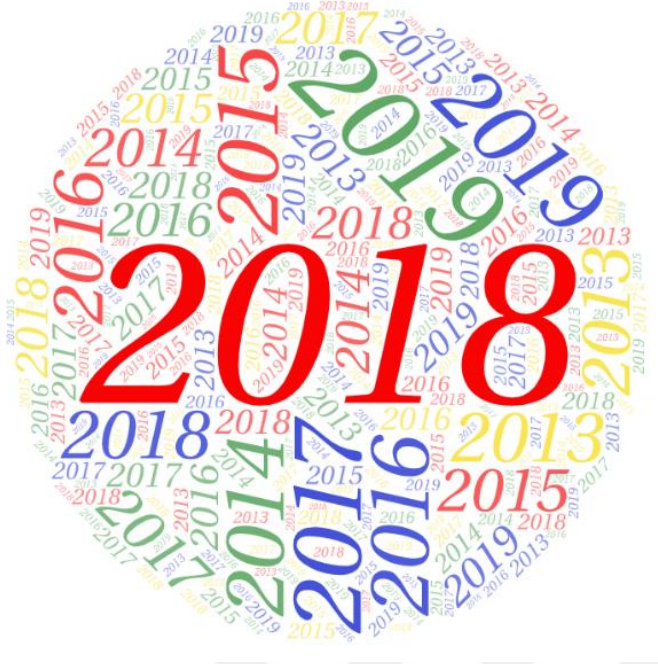
Şekil 6.1. Makalelerin Yayımlandığı Yıllara İlişkin Kelime Bulutu Analizi

Şekil 6.1’de makalelerin yayımlandığı yılların sıklıkları yer almaktadır. Şekil dikkate alındığında “2018” yılının öne çıktığı görülmektedir. 2018 yılı ile birlikte “2019” yılının da dikkat çektiği görülmektedir.