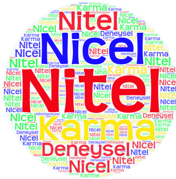
Şekil 6.7. Makalelerin Araştırma Yöntemlerine İlişkin Kelime Bulutu Analizi

Şekil 6.7’de makalelerin araştırma yöntemlerine yer verilmektedir. Şekil dikkate alındığında araştırma yöntemlerinden “Nitel” araştırmanın öne çıktığı görülmektedir.