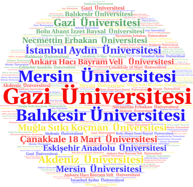
Şekil 6.2. Makalelere Katkıda Bulunan Üniversitelere İlişkin Kelime Bulutu Analizi

Şekil 6.2’de makalelere en çok katkıda bulunan 10 üniversite yer almaktadır. Şekil dikkate alındığında “Gazi Üniversitesi”nin öne çıktığı görülmektedir. Bununla birlikte “Mersin Üniversitesi” ve “Balıkesir Üniversitesi”nin görselde dikkat çektiği görülmektedir.