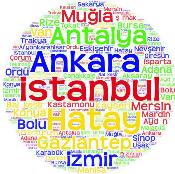
Şekil 6.15. Makalelerde Araştırılan İllere İlişkin Kelime Bulutu Analizi

Şekil 6.15’de makalelerde baz alınan illere yer verilmektedir. Şekil incelendiğinde “İstanbul” un öne çıktığı görülmektedir.