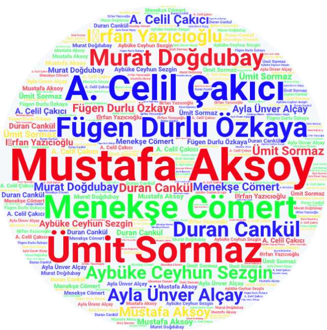
Şekil 6.4. Makalelere Katkıda Bulunan Yazarlara İlişkin Kelime Bulutu Analizi