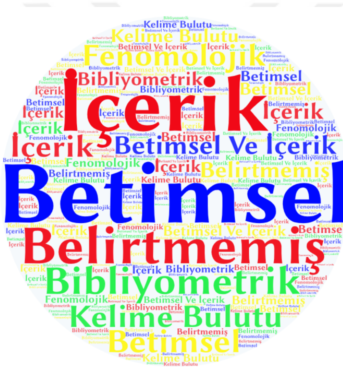
Şekil 6.9.2. Makalelerin Veri Analizine İlişkin Kelime Bulutu Analizi

Şekil 6.9.1’de nitel yöntem benimsenerek yazılan makalelerde kullanılan analiz yöntemleri yer almaktadır. Şekil incelendiğinde “Betimsel” analizinin öne çıktığı görülmektedir. Bununla birlikte içerik analizinin de dikkat çektiğini söyleyebiliriz.