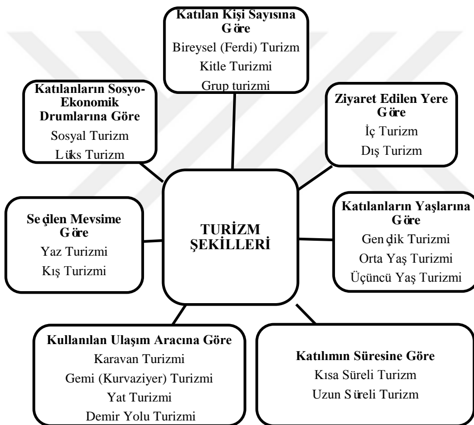
Şekil 2.3.1. Turizm Şekilleri