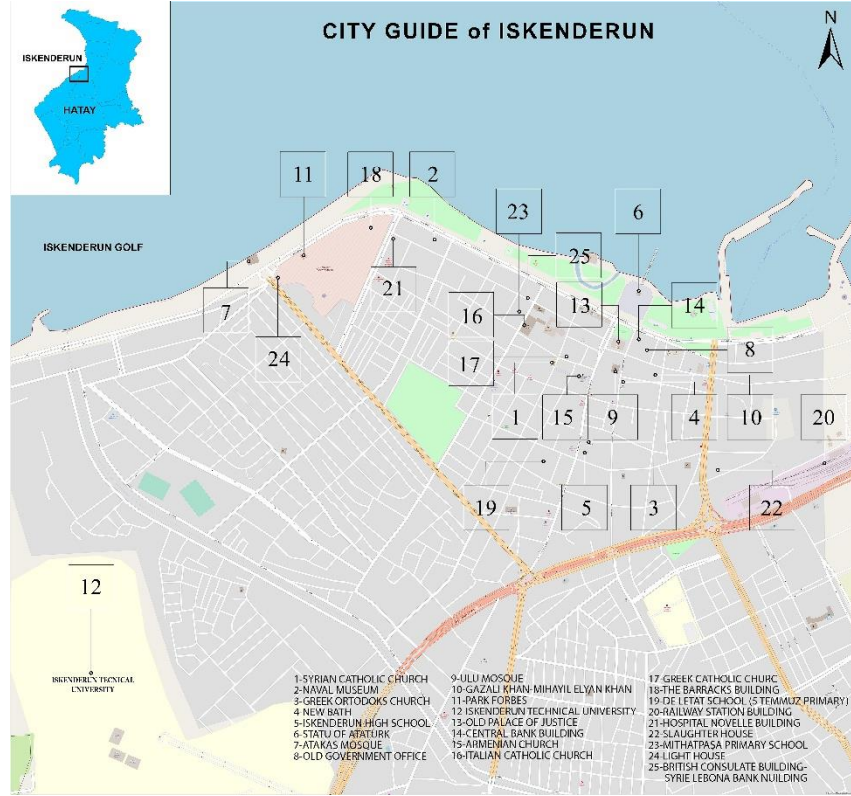
Şekil 11. “Gör Anla Anlat 2” aktivitesi sonuç ürünü; İskenderun kent rehberi panosu (Harita altlığı, OpenStreetMap kullanılarak aktivite için yazarlar tarafından hazırlanmıştır).

kalan yerlerin gösterilmesi istenmiştir. Haritaya katılımcılar tarafından gösterilen yerler eklenerek çıktı (100*140) alınmış ve oluşturulan İskenderun kent rehberi proje sonunda yapılan sergide sunulmuştur (Şekil 11).