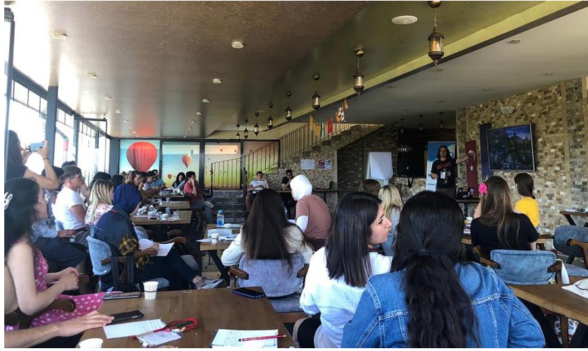
Şekil 4. “Farklıyız ama Aynıyız” aktivitesinde katılımcıların geldikleri ülkelerdeki somut kültürel miras öğelerini anlatan sunumlar

Proje etkinliklerinin kültürel miras farkındalığı artırma bağlamında değerlendirilmesi bölümünde “Kültürel miras varlıkları ile ilgili sunum hazırlama”, ankete katılan katılımcılar arasında 4,21 ortalama puanı ile beşinci sırada yer almaktadır (Ek-2).