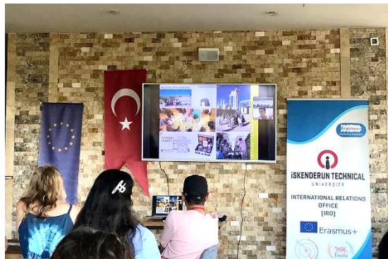
Şekil 10. Katılıyorum Koruyorum 1 aktivitesinde kültürel mirası koruma ve katılım süreçleri üzerine çevrimiçi sunum

Kültürel Mirası Tanıyalım” başlıklı olup kültürel mirası koruma yöntemleri ve kültürel mirası korumada katılımın önemi hakkında bilgi vermektedir.