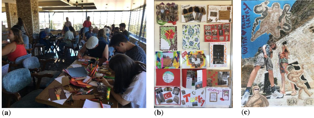
Şekil 7. “Yapıyorum/Özlemsüyorum” aktivitesinde: (a) Katılımcıların gezilen miras öğelerine ilişkin kartpostal yapımı (b) Bazı kartpostal örnekleri (c) En çok beğenilen kartpostal örneği

“Gör Anla Anlat 1” aktivitesinde katılımcılar gezilip görülen somut olan kültürel mirasa ilişkin deneyimlerinin aktarıldığı (yazılı ve görsel verilerin kullanıldığı) poster tasarlanmış ve sonuç ürünler sergilemiştir. Bu etkinlikle amaçlanan, katılımcıların Hatay kültürel mirasının anlamı ve önemine ilişkin oluşan farkındalıklarını pekiştirmektir. Katılımcılardan dijital ortamda (Photoshop uygulaması) 50*70 ebatlarında bir paftaya somut kültürel miras öğeleri hakkında sadece kendi objektiflerinden çıktıkları fotoğrafları ve kendi ürettikleri yazılı ve görsel verileri kullanarak bir poster tasarımı yapmaları talep edilmiştir. Bu aktivitede kültürel kaynaşmayı artırmak için katılımcılardan grup halinde çalışmaları istenmiş ve toplam 43 katılımcı 4 ya da 5 kişiden oluşan 9 gruba ayrılmıştır. Gruplar oluşturulurken her grupta; bir adet